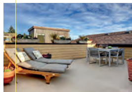
Suelos de terrazas.