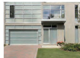
Entradas de viviendas particulares.