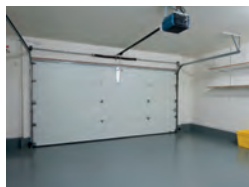
Suelos de garajes.

Una de las maneras de renovar o proteger un suelo, es a través de la pintura, así podemos darle un aspecto renovado a la vez que le aportamos resistencia y protección frente al tránsito de personas o tráfico ligero de coches en distintos suelos: